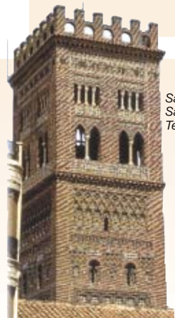
San Salvador, Teruel

Durante la presencia de los árabes en la Península, éstos construyeron edificios religiosos y civiles en los que destacaba la importancia del agua y de la vegetación. Las laberínticas ciudades hispano-musulmanas se alineaban irregularmente con calles estrechas y fusionaban elementos artísticos cristianos y árabes como consecuencia de la convivencia durante la Edad Media.