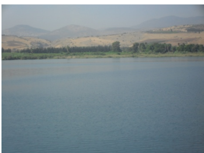
Mar de Galilea ( Llac Tiberiades)