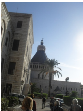
Basílica de l'Anunciació en Nazaret.