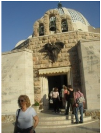
Església de la Nativitat en Betlem

2.- Explica quins fet importants de la vida de Jesús van transcorre als indrets que mostren les diferents fotografies.