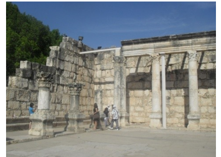
Ruïnes de la Sinagoga de Cafarnaum