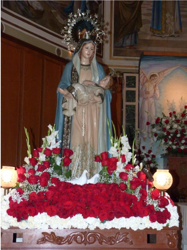
FESTA DE LA CANDALERA A TORTOSA