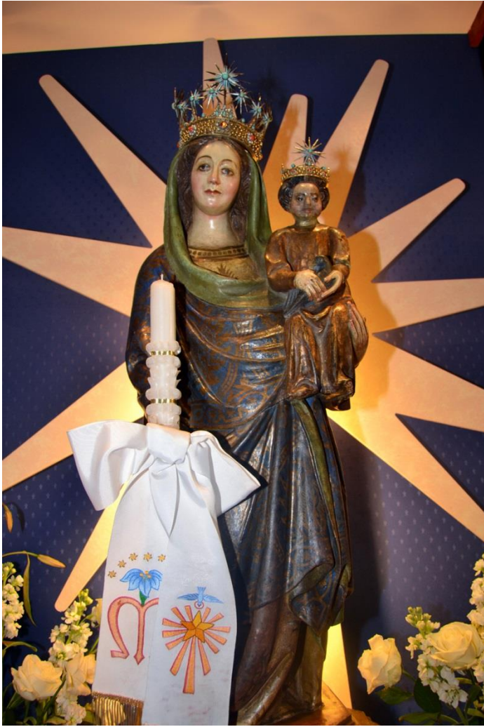
VERGE DE LA CANDELERA A VALLS